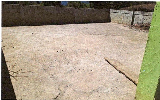
Foto 3: Mejoramiento de estructura de tipo pórtico e instalación de lámina troquelada calibre 26.